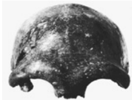
▲▶박물관에 전시된 네안데르탈인의 두개골들

네안데르탈인은 20세기 초에 독일 뒤셀도르프 근처 네안데르탈 계곡에 있는 동굴에서 처음으로 발견되어 세상에 알려지기 시작한 존재이다. 이